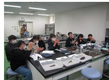
魚類査定の正解発表