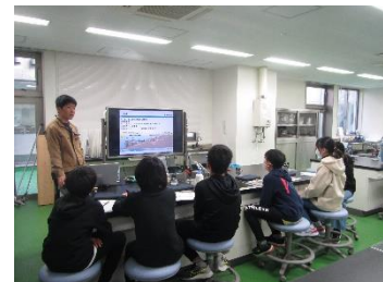
弊社の取り組みに関する講義(2)