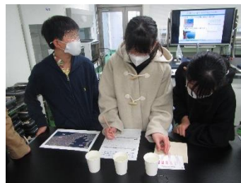
水質測定の実体験