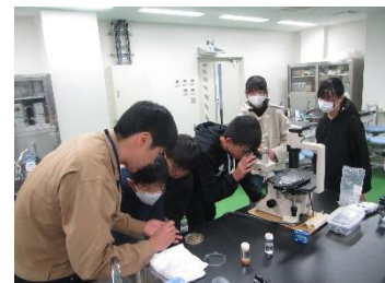
プランクトン検鏡の実体験