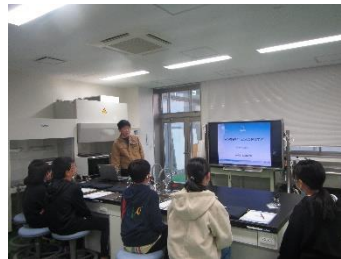
弊社の取り組みに関する講義(1)

前日の夜は楽しみにしていた函館山からの夜景をばっちり見ることができて本当に良かったですね。きっと一生の思い出になることでしょう。ぜひともまた函館に遊びにいらしてください！